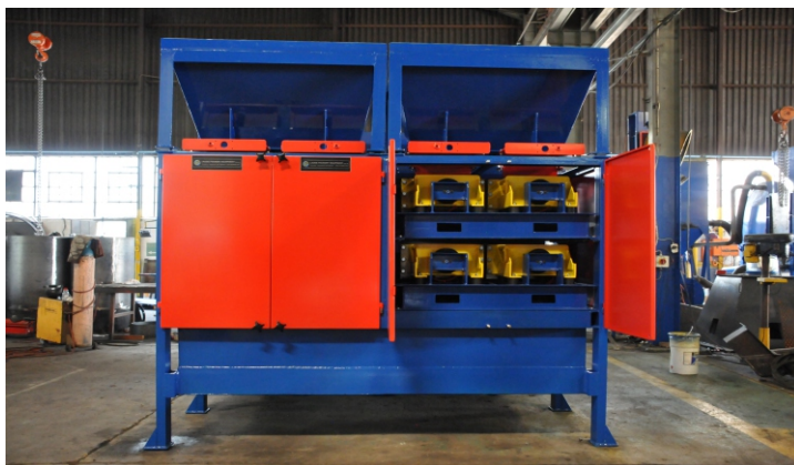
Sekundarna regeneracija peska, 90 % ponoven izkoristek