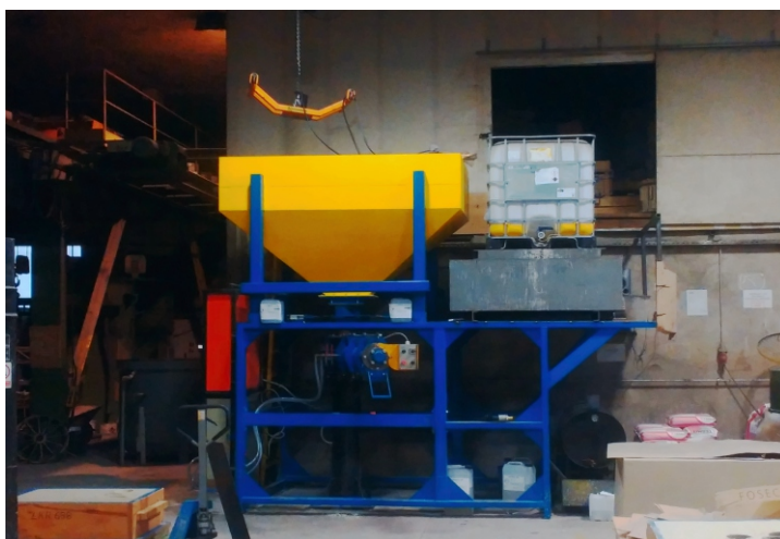
Robusten mešalec peska v livarni, enostavno vzdrževanje